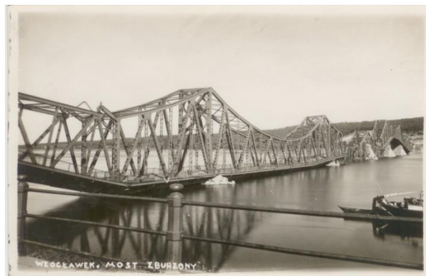
W 1939 r. most został wysadzony przez wycofujące się wojsko polskie. Niemcy bardzo szybko przystąpili jednak do jego odbudowy, którą zakończyli w 1940 r.

W 1945 r. ( w nocy z 19 na 20 stycznia ) most został ponownie wysadzony - tym razem przez wycofujące się oddziały niemieckie.