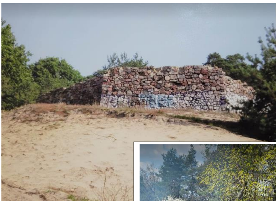
Zdj. Fragment tzw. „murów”.

Obecnie ten piękny teren pełni funkcję tarasu widokowego na całe miasto i jest świetnym celem spacerów oraz miejscem spotkań. Jest tam wyznaczone miejsce na ognisko oraz ławeczki. Okoliczne drzewa dodają miejscu uroku, lecz niestety zasłaniają widok na miasto. Problem ma rozwiązać planowana budowa wieży widokowej.