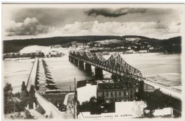
Zdj. z 1937 r. Widok na mosty: drewniany z 1916 r. i stalowy w trakcie budowy. W głębi panorama Szpetala Dolnego ( dzisiejsze Zawisze )

Budowa tego mostu rozpoczęła się wiosną 1935 r. według projektu Ministerstwa Komunikacji, ale przy współudziale miasta. Budowano go obok istniejącego mostu drewnianego. Oficjalne otwarcie mostu i nadanie imienia nastąpiło w dn. 25. IX. 1937 r.